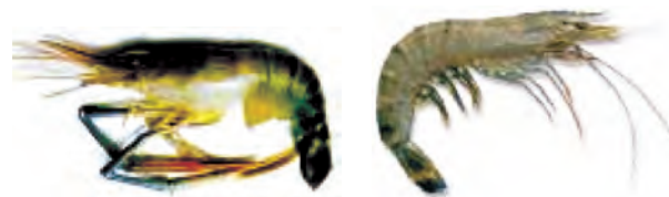
मेक्रोब्रेकियम रोजेन वर्गी (ताजा पानी)

भविष्य में समुद्री मछलियों का भंडार (stock) कम होने की अवस्था में इन मछलियों की पूर्ति संवर्धन के द्वारा हो सकती है। इस प्रणाली को समुद्री संवर्धन (मेरीकल्चर) कहते हैं।