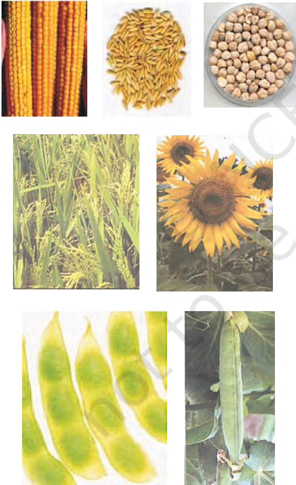
चित्र 15.1: विभिन्न प्रकार की फसलें

ऊर्जा की आवश्यकता के लिए अनाज; जैसे-गेहूँ, चावल, मक्का, बाजरा तथा ज्वार से कार्बोहाइड्रेट प्राप्त होता है। दालें जैसे चना, मटर, उड़द, मूँग, अरहर, मसूर से प्रोटीन प्राप्त होती है और तेल वाले बीजों; जैसे-सोयाबीन, मूँगफली, तिल, अरंड, सरसों, अलसी तथा सूरजमुखी से हमें आवश्यक वसा प्राप्त होती है (चित्र 15.1)। सब्जियाँ, मसाले तथा फलों से हमें विटामिन तथा खनिज लवण, कुछ मात्रा में प्रोटीन, वसा तथा कार्बोहाइड्रेट भी प्राप्त होते हैं। चारा फसलें; जैसे-वर्सीम, जई अथवा सूडान घास का उत्पादन पशुधन के चारे के रूप में किया जाता है।