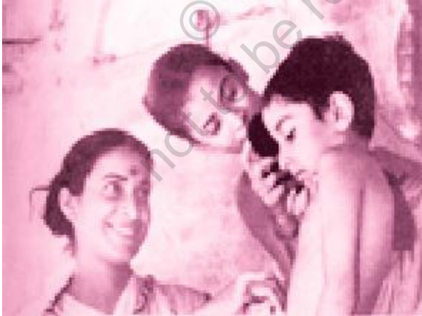
पथेर पांचाली फ़िल्म का एक दृश्य

शूटिंग की शुरुआत में ही एक गड़बड़ हो गई। अपू और दुर्गा को लेकर हम कलकत्ता* से सत्तर मील पर पालसिट नाम के एक गाँव गए। वहाँ रेल-लाइन के पास