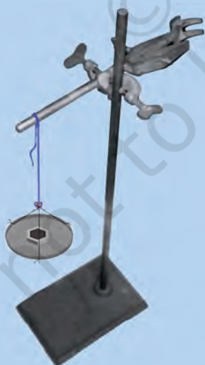
चित्र 3.5 : एक लोहे के स्टैण्ड पर क्लैम्प से लटकता हुआ एक धागा।

एक क्लैम्प युक्त लोहे का स्टैण्ड लीजिए। लगभग 60 सेमी लम्बा एक सूती धागा लीजिए। इसे क्लैम्प से बाँध दीजिए जिससे यह स्वतंत्र रूप से लटक जाए, जैसा चित्र 3.5 में प्रदर्शित है। मुक्त सिरे पर