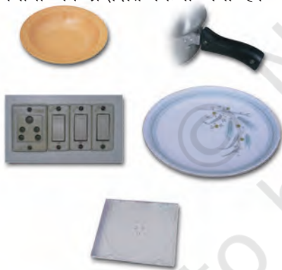
थर्मोसेटिंग प्लास्टिक से निर्मित वस्तुएँ

दूसरी ओर, कुछ प्लास्टिक ऐसे हैं जिन्हें एक बार साँचे में ढाल दिया जाता है तो इन्हें ऊष्मा देकर नर्म नहीं किया जा सकता। ये थर्मोसेटिंग प्लास्टिक कहलाते हैं। दो उदाहरण हैं - बैकेलाइट और मेलामाइन। बैकेलाइट ऊष्मा और विद्युत का कुचालक है। यह बिजली के स्विच, विभिन्न बर्तनों के हत्थे, आदि बनाने में काम आता है। मेलामाइन एक बहुउपयोगी पदार्थ है। यह आग का प्रतिरोधक है तथा अन्य प्लास्टिक की अपेक्षा ऊष्मा को सहने की अधिक क्षमता रखता है। यह फर्श की टाइलें, रसोई के बर्तन और कपड़े बनाने के उपयोग में लिया जाता है जो आग का प्रतिरोध करते हैं। चित्र 3.8 में थर्मोप्लास्टिक और थर्मोसेटिंग प्लास्टिक के विभिन्न उपयोगों को प्रदर्शित किया गया है।