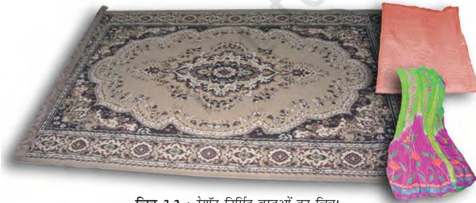
चित्र 3.2 : रेयॉन निर्मित वस्तुओं का चित्र।

आपने कक्षा VII में पढ़ा है कि रेशम कीट से प्राप्त किया जाता है। इसकी खोज चीन में हुई थी और इसे लम्बे समय तक कड़ी सुरक्षा में गोपनीय रखा गया। रेशम रेशे से प्राप्त कपड़ा बहुत मँहगा होता है परन्तु इसकी सुन्दर बुनावट (texture) ने प्रत्येक व्यक्ति को मोह लिया। रेशम को कृत्रिम रूप से बनाने के प्रयास किये गए। उन्नीसवीं शताब्दी के अन्तिम छोर पर वैज्ञानिकों को रेशम समान गुणों वाले रेशे प्राप्त करने में सफलता प्राप्त हुई। इस प्रकार का रेशा काष्ठ लुगदी के रासायनिक उपचार से प्राप्त किया गया। यह रेशा रेयॉन अथवा कृत्रिम रेशम कहलाया। यद्यपि रेयॉन प्राकृतिक स्रोत काष्ठ लुगदी से प्राप्त किया जाता है, यह एक मानव निर्मित रेशा है। यह रेशम से सस्ता होता है परन्तु इसे रेशम रेशों के समान बुना जा सकता है। इसे रंगों की कई किस्मों में रँगा जा सकता है। रेयॉन को कपास के साथ मिलाकर बिस्तर की चादरें बनाते हैं अथवा ऊन के साथ मिलाकर कालीन या गलीचा बनाते हैं। (चित्र 3.2)।