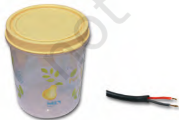
थर्मोप्लास्टिक से निर्मित वस्तुएँ