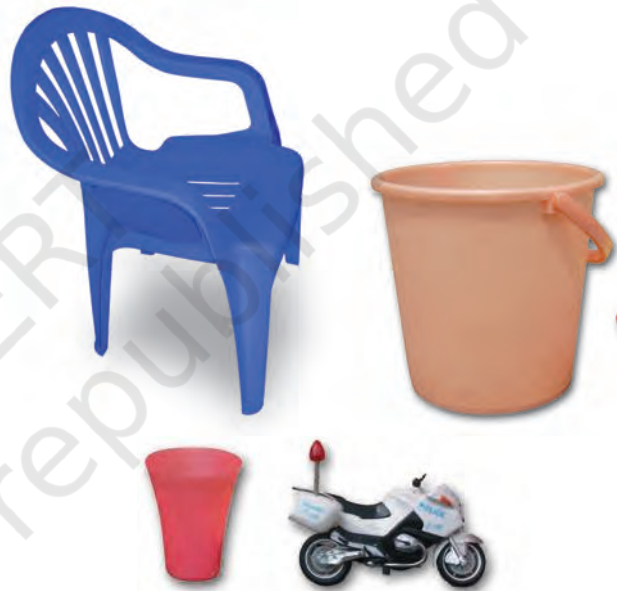
चित्र 3.7 : प्लास्टिक-निर्मित विभिन्न वस्तुएँ।

प्लास्टिक की वस्तुएँ सभी सम्भव आकारों और साइजों में उपलब्ध हैं, जैसा आप चित्र 3.7 में देख सकते हैं। क्या आपको आश्चर्य नहीं होता कि यह कैसे संभव है? तथ्य यह है कि प्लास्टिक आसानी से साँचे में ढाला जा सकता है अर्थात् इसे कोई भी आकार दिया जा सकता है। प्लास्टिक का पुनः चक्रण हो सकता है, इसे पुनः प्रयुक्त किया जा सकता है, इसे रँगा और पिघलाया जा सकता है, इसे बेलकर चद्दरों में बदला जा सकता है अथवा इसकी तारें बनायी जा सकती हैं। इसलिए इनके इतने विभिन्न प्रकार के उपयोग हैं।