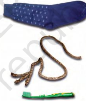
चित्र 3.3 : नाइलॉन से निर्मित विभिन्न वस्तुएँ।

हम नाइलॉन से निर्मित कई वस्तुओं को उपयोग में लाते हैं, जैसे— जुराबें, रस्से, तम्बू, दाँत साफ़ करने का ब्रुश, कारों की सीट के पट्टे, स्लीपिंग बैग (शयन थैला), परदे, आदि (चित्र 3.3)। नाइलॉन का उपयोग पैराशूट