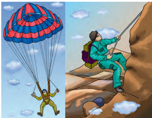
चित्र 3.4 : नाइलॉन रेशों के उपयोग।