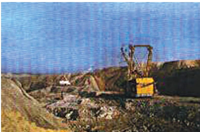
चित्र 5.2 : कोयले की एक खान।

वायु में गर्म करने पर कोयला जलता है और मुख्य रूप से कार्बन डाइऑक्साइड गैस उत्पन्न करता है।