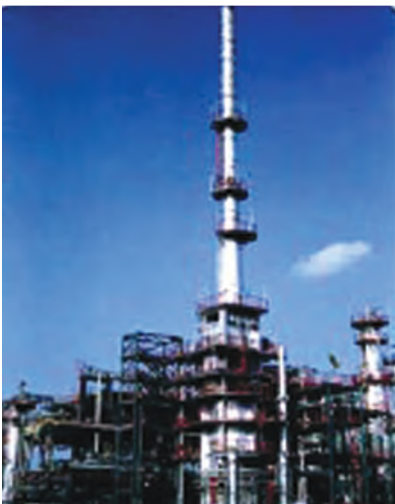
चित्र 5.5 : पेट्रोलियम परिष्करण।

को पृथक करने का प्रक्रम परिष्करण कहलाता है। यह कार्य पेट्रोलियम परिष्करण में सम्पादित किया जाता है (चित्र 5.5)।