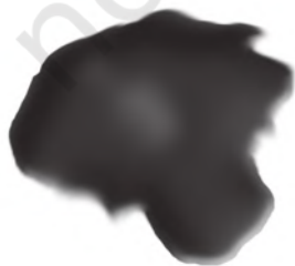
चित्र 5.3 : कोलतार।

यह एक अप्रिय गंध वाला काला गाढ़ा द्रव होता है (चित्र 5.3)। यह लगभग 200 पदार्थों का मिश्रण