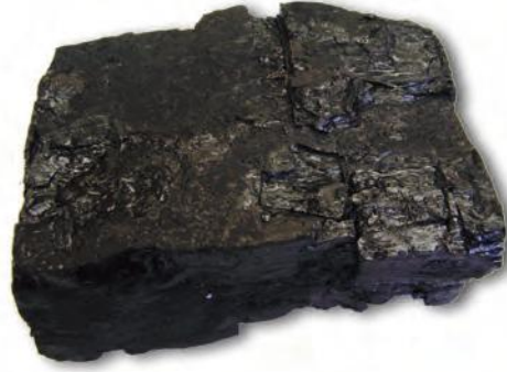
चित्र 5.1 : कोयला।

आपने कोयला देखा होगा या इसके बारे में सुना होगा (चित्र 5.1)। यह पत्थर जैसा कठोर और काले रंग का होता है।