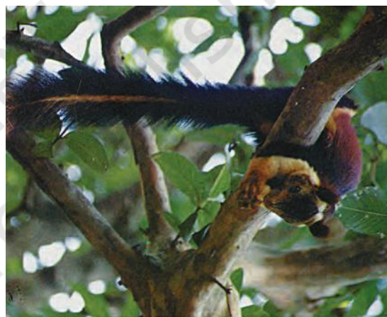
चित्र 7.3(b) : विशाल गिलहरी।