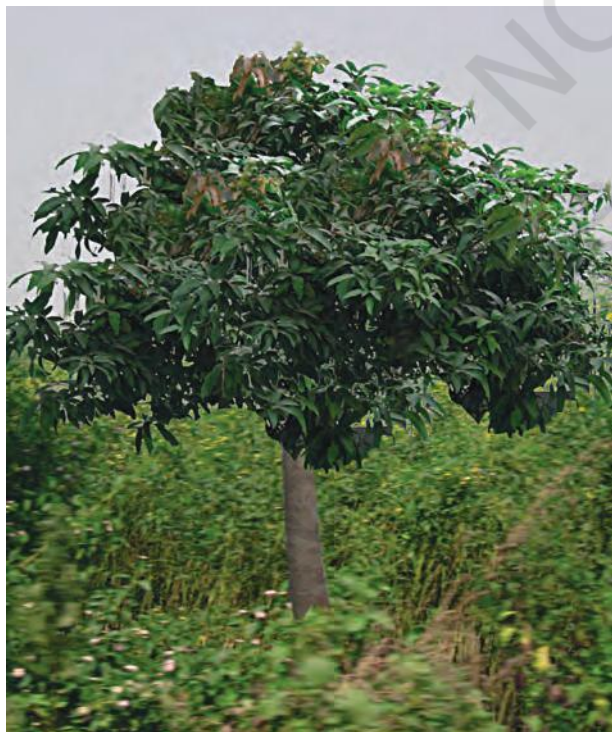
चित्र 7.3(a) : जंगली आम।