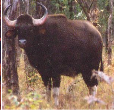
चित्र 7.5 : जंगली भैंसा।