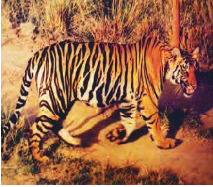
चित्र 7.4 : बाघ।