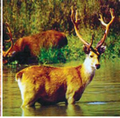
चित्र 7.6 : बारहसिंघा।