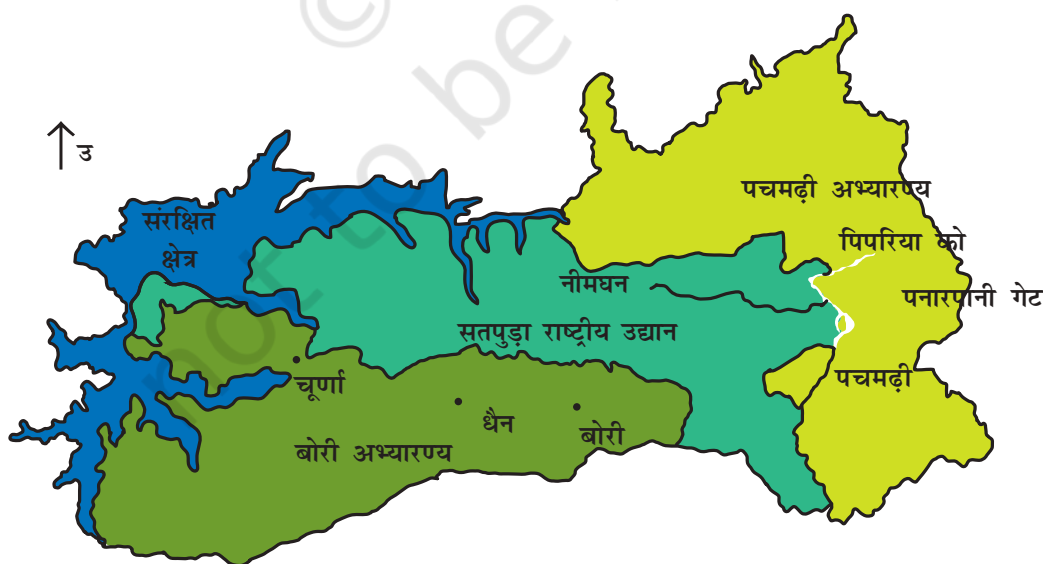
चित्र 7.1 : पचमढ़ी जैवमण्डल आरक्षित क्षेत्र।