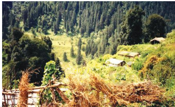
चित्र 16.2 वन्यजीवन का एक दृश्य

उद्योग इन वनों को अपनी फैक्ट्री के लिए कच्चे माल का स्रोत मात्र ही मानते हैं। निहित स्वार्थ से लोगों का एक बड़ा वर्ग सरकार से उद्योगों के लिए कच्चे माल को बहुत कम मूल्य पर प्राप्त करने में लगा रहता है। क्योंकि स्थानीय निवासियों की अपेक्षा इन व्यक्तियों की पहुँच सरकार में काफी ऊपर तक होती है, अतः उन्हें उस क्षेत्र के संपोषित विकास में कोई रुचि नहीं होती। उदाहरण के लिए, किसी वन के टीक के सभी वृक्षों को काटने के बाद, वे दूरस्थ वनों से टीक प्राप्त करने लगेंगे। उन्हें इस बात से कोई मतलब नहीं है कि वे इनका इष्टतम उपयोग सुनिश्चित करें जिससे कि वह आगे आने वाली पीढ़ियों को भी उपलब्ध हो सके। आपके विचार में लोगों को इस प्रकार व्यवहार करने से कैसे रोका जा सकता है?