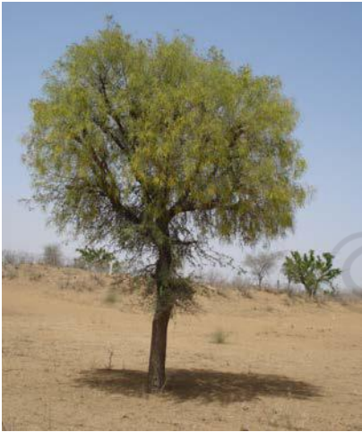
चित्र 16.3 खेजरी वृक्ष

अध्ययनों ने इस बात को स्थापित कर दिया है कि वनों के परंपरागत उपयोग के तरीकों के विरुद्ध पूर्वाग्रह का कोई ठोस आधार नहीं है। उदाहरणतः, विशाल हिमालय राष्ट्रीय उद्यान के सुरक्षित क्षेत्र में एल्पाइन के वन हैं जो भेड़ों के चरागाह थे। घुमंतु (खानाबदोश) चरवाहे प्रत्येक वर्ष ग्रीष्मकाल में अपनी भेड़ें घाटी से इस क्षेत्र में चराने के लिए ले जाते थे। परंतु इस राष्ट्रीय उद्यान की स्थापना के बाद इस परंपरा को रोक दिया गया। अब यह देखा गया है कि पहले तो यह घास बहुत लंबी हो जाती है, फिर लंबाई के कारण जमीन पर गिर जाती है जिससे नयी घास की वृद्धि रुक जाती है। संरक्षित क्षेत्रों में स्थानीय निवासियों को बलपूर्वक रोकने की प्रबंधन नीति संभवतः लंबे समय तक सफल नहीं हो पाई। किसी भी प्रकार से वनों को होने वाली क्षति के लिए केवल स्थानीय निवासियों को ही उत्तरदायी ठहराना ठीक नहीं है। हम औद्योगिक आवश्यकताओं एवं विकास परियोजनाओं जैसे कि सड़क एवं बाँध निर्माण से वनों के विनाश अथवा इसको होने वाली क्षति से आँखें नहीं मूँद सकते। इन संरक्षित क्षेत्रों में पर्यटकों के द्वारा अथवा उनकी सुविधा के लिए की गई व्यवस्था से होने वाली क्षति के बारे में भी विचार करना होगा।