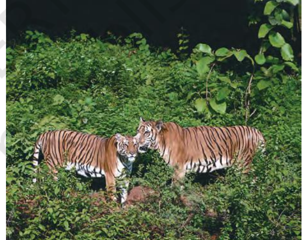
चित्र 1.3 भारत के विभिन्न चिड़ियाघरों में वन्य प्राणी