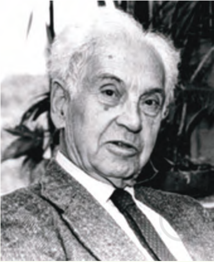
एरनस्ट मेयर (1904 - 2004)

एरनस्ट मेयर का जन्म 5 जुलाई, 1904 में केंपटन, जर्मनी में हुआ था। आप हावर्ड विश्वविद्यालय के विकासपरक जीव वैज्ञानिक थे, जिन्हें '20वीं शती का डार्विन' कहा गया। आप अब तक के 100 महान वैज्ञानिकों में से एक थे। मेयर ने सन् 1953 में हावर्ड विश्वविद्यालय की कला एवं विज्ञान संकाय में नौकरी प्राप्त की और 1975 में एलेक्जेंडर अगासीज प्रोफ़ेसर ऑफ़ जुलोजी एमीरिटस की पदवी के साथ अवकाश प्राप्त किया। अपने 80 सालों के कार्य जीवन में आपका पक्षी-विज्ञान, वर्गीकरण-विज्ञान, प्राणि-भूगोल, विकास, वर्गिकी तथा जीव विज्ञान के इतिहास एवं दर्शन आदि पर अनुसंधान केंद्रित रहा। आप ने लगभग अकेले ही विकासीय जीव विज्ञान के केंद्रीय प्रश्न जाति विविधता की उत्पत्ति को खड़ा किया, जो कि आज सच है। इसके साथ ही आपने हाल ही में स्वीकृत जीव वैज्ञानिक जाति वर्गिकी की परिभाषा की अगुवाई की। मेयर को तीन पुरस्कार दिए गए, जिन्हें व्यापक तौर पर जीव विज्ञान के तीन ताजों की संज्ञा दी जाती है: 1983 में बालजॉन प्राइज, 1998 में जीव विज्ञान के लिए इंटरनेशनल प्राइज और 1999 में क्राफ़र्ड प्राइज। मेयर ने 100 वर्ष की आयु में 2004 को स्वर्गवासी हुए।