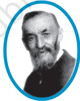
G. Peano (1858-1932 A.D.)

निगमन के विपरीत, आगमन तर्क प्रत्येक स्थिति के अध्ययन पर आधारित होता है तथा इसमें प्रत्येक एवं हर संभव स्थिति को ध्यान में रखते हुए घटनाओं के निरीक्षण द्वारा एक अनुमानित कथन विकसित किया जाता है। इसको गणित में प्रायः प्रयोग किया जाता है तथा वैज्ञानिक चिंतन, जहाँ आँकड़ों का संग्रह तथा विश्लेषण मानक होता है, का यह मुख्य आधार है। इस प्रकार, सरल भाषा में हम कह सकते हैं कि आगमन शब्द का अर्थ विशिष्ट स्थितियों या तथ्यों से व्यापकीकरण करने से है।